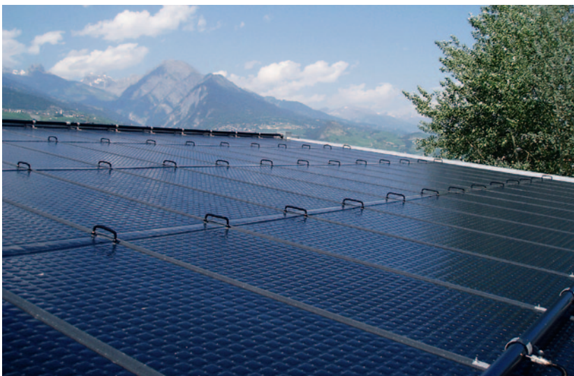
Figure: Toiture Solaire AS – capteur solaire & couverture métallique durable

La performance d'une installation solaire thermique est directement liée au consommateur auquel elle est connectée. Contrairement à une installation solaire photovoltaïque raccordée au réseau, le rendement d'une installation solaire thermique dépend directement du profil du consommateur qu'elle alimente. Si la consommation s'effectue à une température pour laquelle le type de capteur utilisé n'est pas destiné, la performance du système sera réduite.