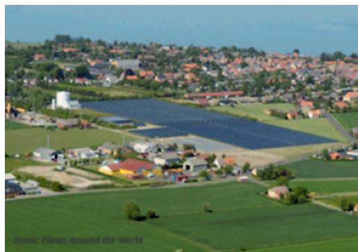
Chauffage à distance solaire de Marstal au Danemark (Marstal Fjernvarme) et conduite de chauffage à distance préisolée

Au courant des années '90 déjà, des réseaux de chauffage «solaire» à distance ont vu le jour au Danemark. L'énergie solaire permet une autonomie quasi-totale pendant la période estivale. En période hivernale la biomasse fournit le complément d'énergie. Le chauffage à distance (CAD) de Marstal (DK), par exemple, est composée de plus de 18 000 m 2 de capteurs solaires, un volume de stockage d'eau de chauffage de l'ordre de 10 000 m 3 . Cette installation solaire couvre