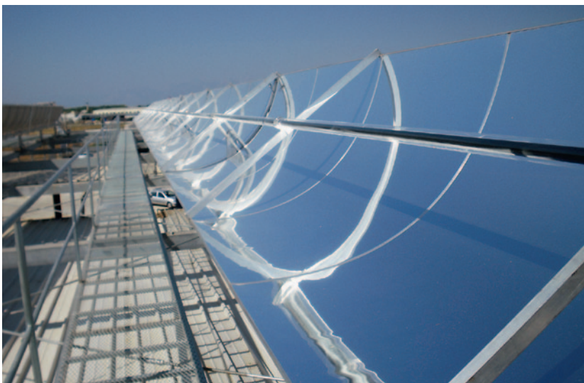
Capteurs cylindro-paraboliques à concentration (CSP) à la Plataforma de Almeria (Espagne)

Le marché européen de chaleur solaire est de l'ordre de 2-3 GWth (Giga Watt thermique), ce qui équivaut à une pose de 3 à 4 millions de m 2 de capteurs solaires par an. La majorité de ce marché est composée de petites installations sur des maisons familiales. La distance entre la production d'énergie thermique par les capteurs solaires et le stockage / le consommateur y est de l'ordre de 10 à 30 mètres seulement. Des conduites de liaison en acier (inoxydable) isolées assurent le transport de l'énergie thermique par le biais du fluide caloporteur. Ce fluide est un mélange d'eau déminéralisée et d'antigel.